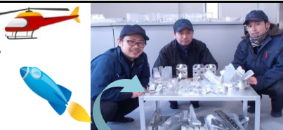
(株)郡上螺子で作られている航空宇宙産業、自動車産業の部品の数々